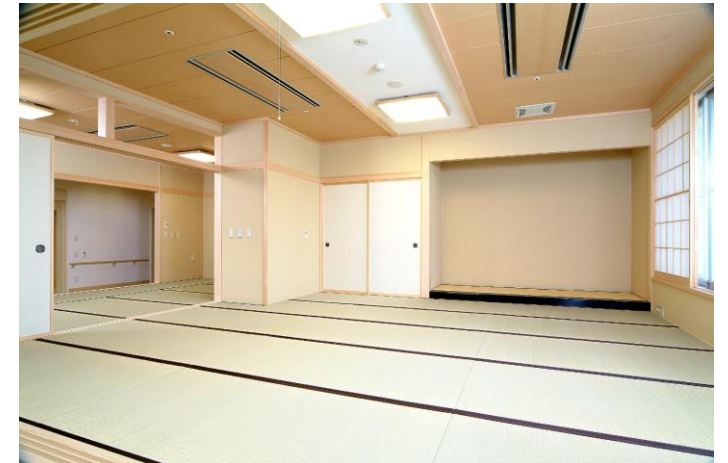
地域交流ホール(和室エリア)