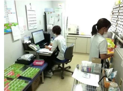
1F看護ステーション