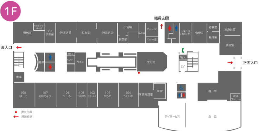
● 現在位置 ← 避難経路