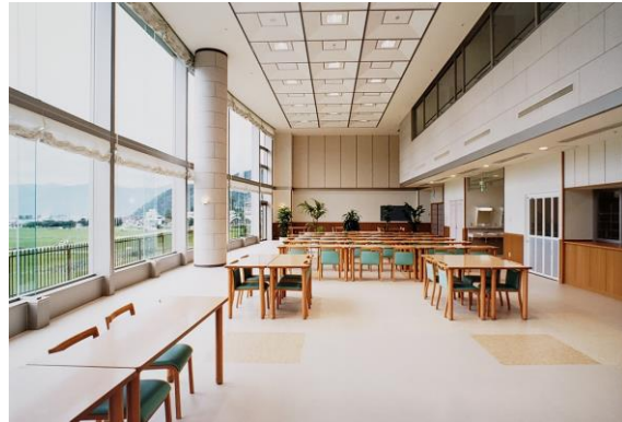
1F全体食堂/デイサービスホール

2F建てでゆったりとしたつくりで、勝山市の様子が一望できます。 特に、食堂/デイサービスホール、大浴場の大窓から眺めはパノラマ感があり 居室も解放感にあふれたものとなっています。