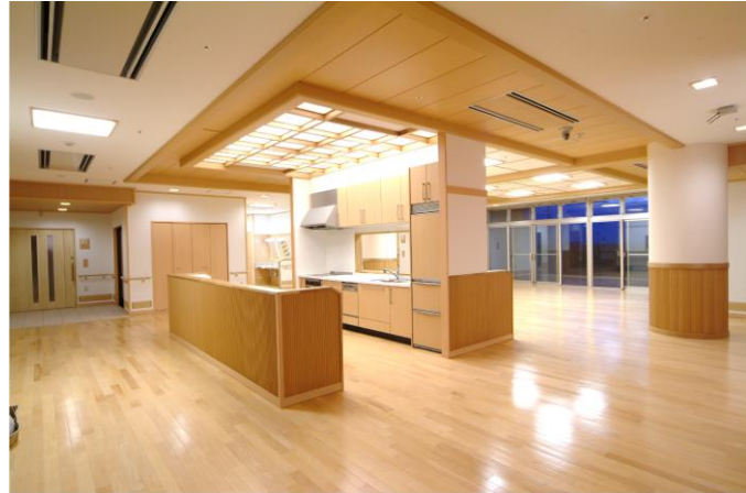
ユニット内共有キッチン/リビング

1ユニットは家庭的な生活リズムを尊重できる10人単位で、和のぬくもりを演出した個室になっています。