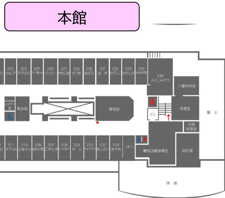
● 現在位置 ← 避難経路