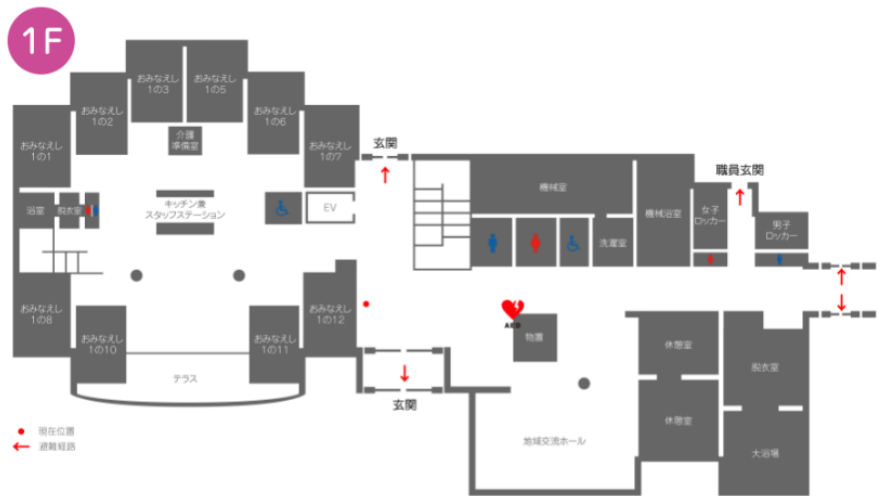
1F:1ユニット+地域交流ホール