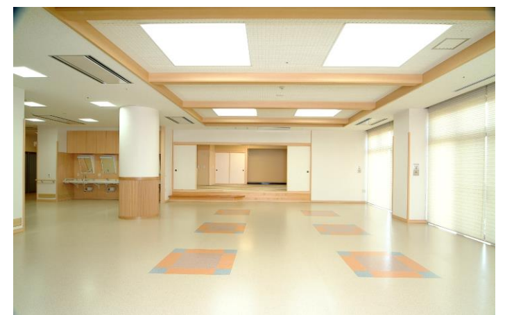
地域交流ホール(大会議エリア)